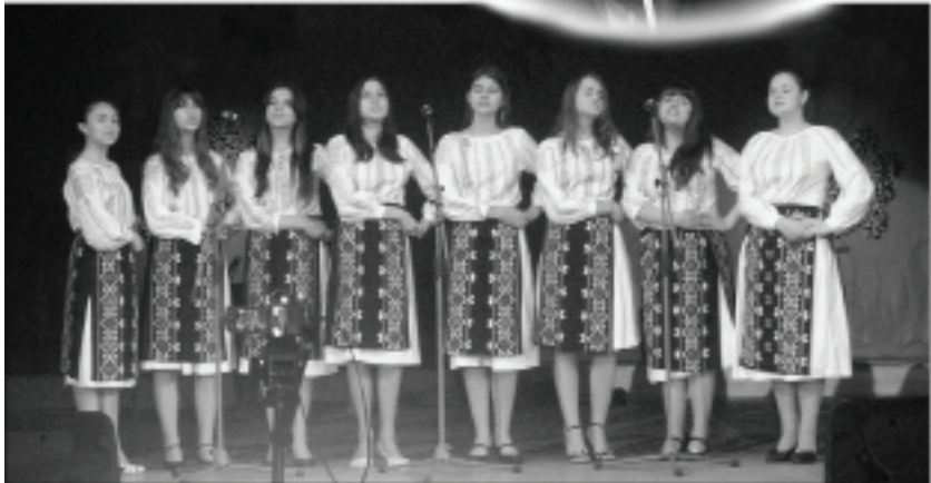
Ansamblul vocal „Prometeu”