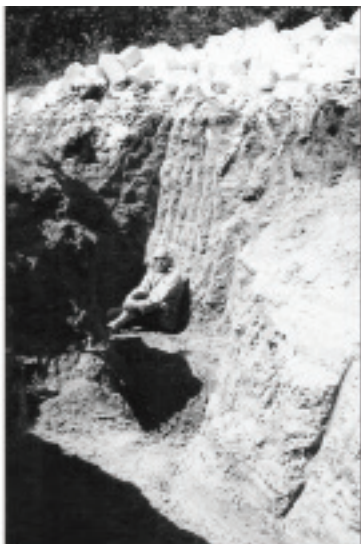
Pe șantierul școlii și în groapa de fundație a Bisericii din Codrii Călărașilor (s. Oricova)