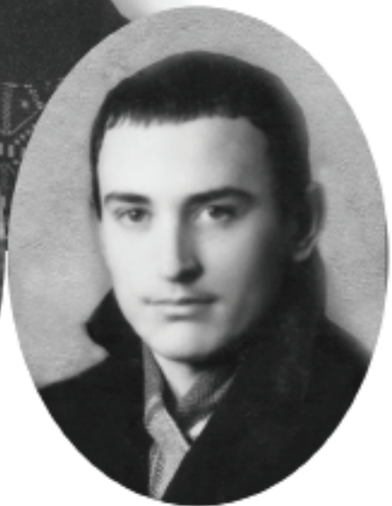
Pe scara adolescenței