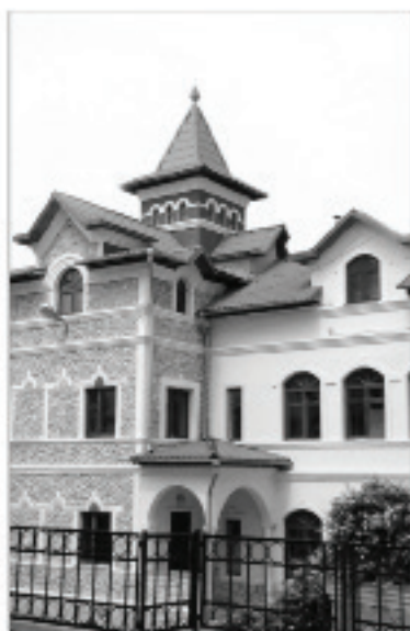
Alte clădiri construite pentru copii și profesori