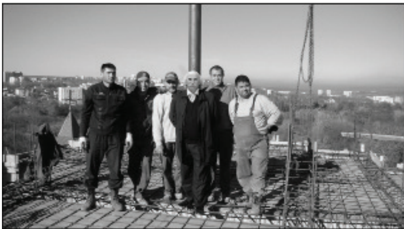
Cu muncitorii, pe șantierul Liceului