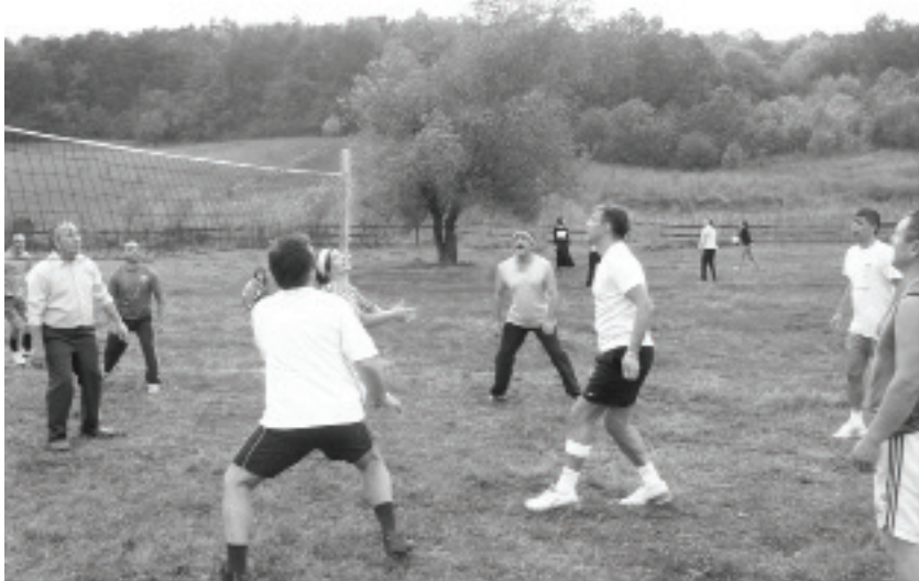
La volei (cu cadrele didactice din liceu)