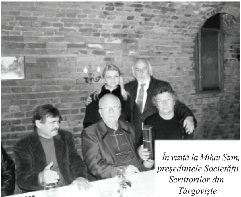
În vizită la Mihai Stan, președintele Societății Scriitorilor din Târgoviște