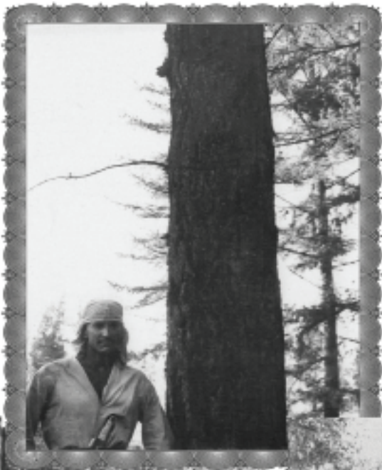
Brad lângă brad (în Munții Altai)