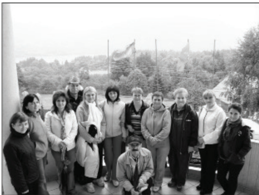
În excursie cu un mic grup de cadre didactice de la Liceul de Creativitate și Inventică „Prometeu-Prim”