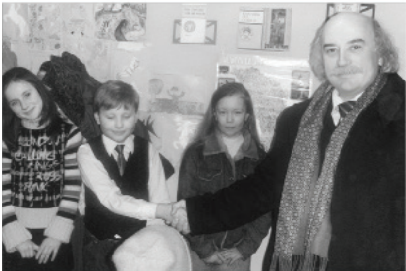
În mijlocul micilor cititori