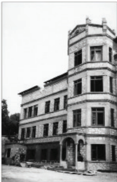
Biserica școlii și unul din blocurile de studii (în construcție)