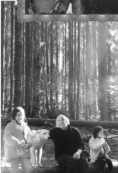
Înconjurat de îngeri (pe Ceahlău)