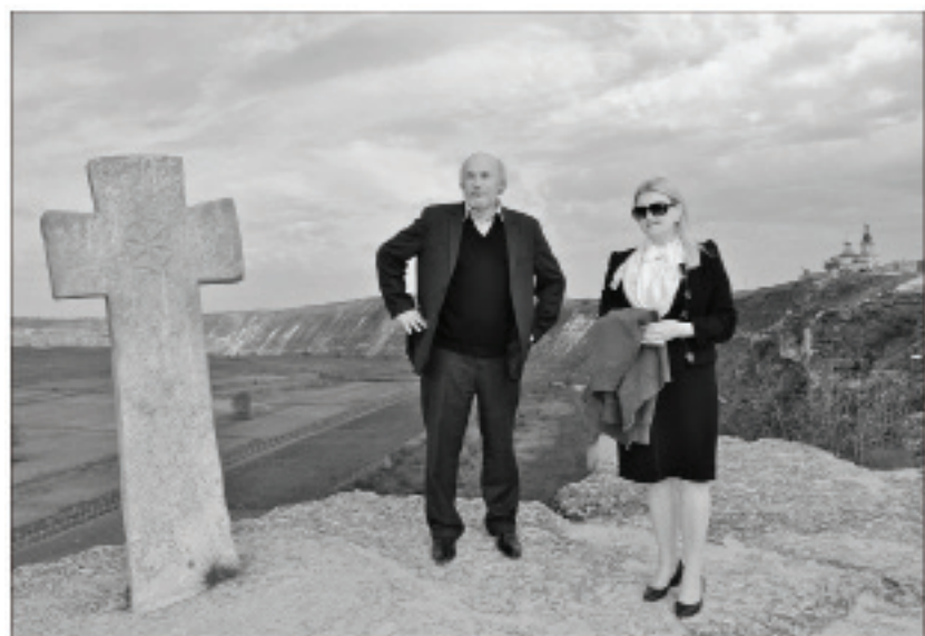
La Orheiul Vechi