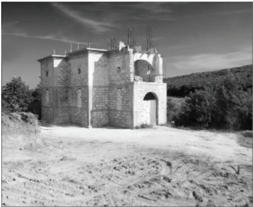
Biserica (în construcție) de la Mănăstirea Pocăinței din Codrii Călărașilor (s. Oricova)