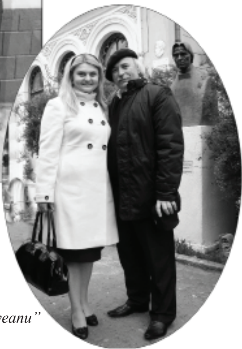
La Casa „Mihail Sadoveanu” din Iași